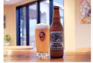
美しい狩野川のほとりで作られた ベアードビール