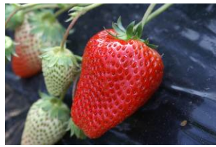
甘みと酸味のバランスが良い 江間のいちご「紅ほっぺ」