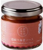
W受賞した6次産業化商品 「殻絞り海老ソース」