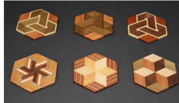
様々な種類の木材を組み合わせた 寄木細工で作ったコースター