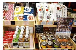
「のもの」ショップ商品