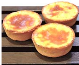
ニューサマーオレンジタルト