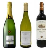
ワイン飲み放題プラン(イメージ)