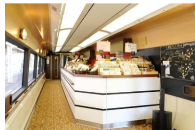
2号車バーカウンター