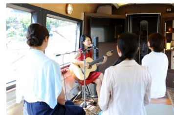
車内イベント風景