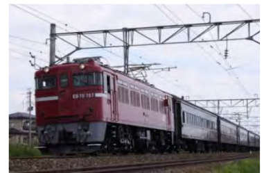
ELレトロ福島号 (イメージ)