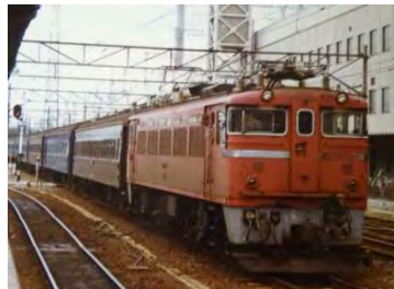
昭和50年代 東北本線旧型客車列車 (イメージ)