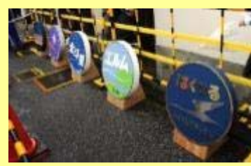
⑥ ヘッドマーク展示