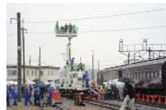
マジックボーイ体験乗車