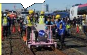
② レールスター体験乗車