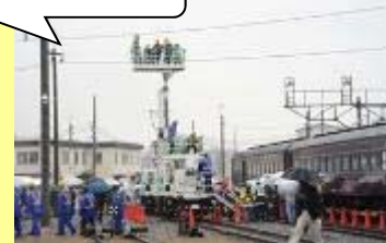
③ マジックボーイ体験乗車