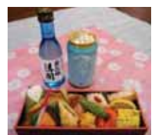
オリジナルメニュー