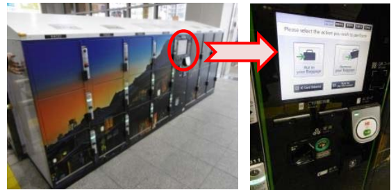
【図5 新設したロッカー】

川越駅西口に新たに川越の蔵造りの街並みをデザインしたコインロッカーを設置しました。訪日外国人のお客さまにもご利用いただきやすいように、日本語のほか、英語、中国語、韓国語に対応した案内の液晶パネルの搭載と、使用方法ステッカーの貼付けをしています。