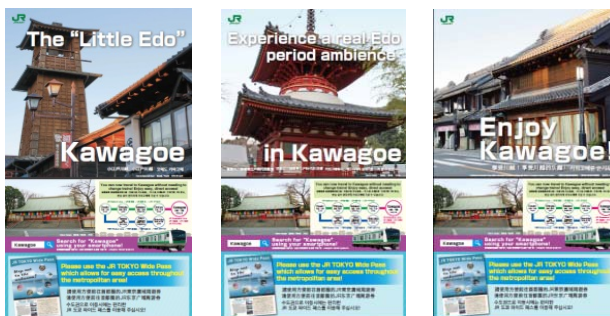
【図2 デジタルサイネージデータ（3種類）】

川越の魅力を紹介する外国語表記のポスターデータを JR 東日本訪日旅行センター（成田空港第1・第2ターミナル、羽田空港、東京駅、新宿駅）のデジタルサイネージに配信しています。