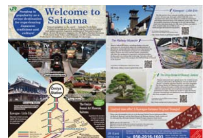
【図4 パンフレット（表）（裏）】