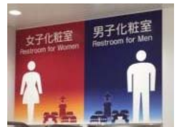
【図7 トイレ案内サイン】

入口にピクトサインを採用したデザインに改修しました。加えて、デザインに小江戸川越の雰囲気を盛り込んでいます。