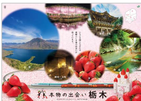
<5つのテーマを表現した大型版ポスター>