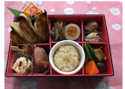
<とちぎ発 本日開店 居酒屋新幹線>