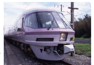
<リゾートエクスプレスゆう>

ポイント：車内にはバーテンダーが乗車、その場で宇都宮カクテルを堪能！そのまま宇都宮市内で開催されるカクテルカーニバルにご参加いただけます。