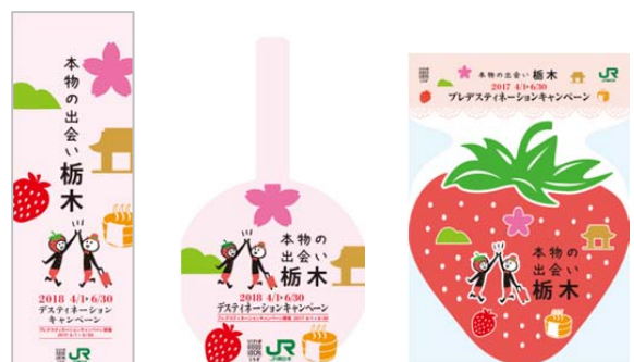
<5つのテーマをあしらった装飾グッズ>