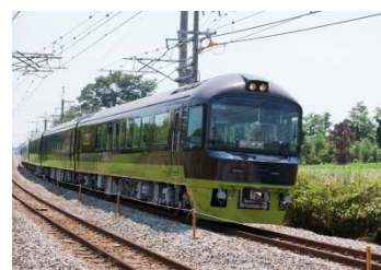
<リゾートやまどり>