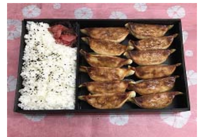
<協同組合宇都宮餃子会監修 「焼餃子ダブル」弁当>