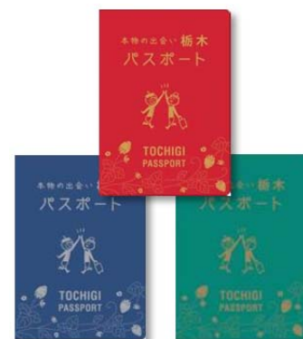
<本物の出会い 栃木パスポート>