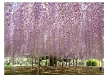
<あしかがフラワーパーク>