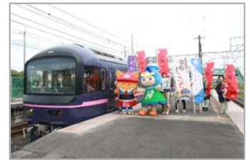
<2016年とちぎまんぷく列車>

ポイント：毎年人気の「とちぎまんぷく列車」は、停車駅ごとの地元自慢の食のふるまいや心あたたまるおもてなしで、身も心も満腹です！