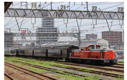
<旧型客車イメージ>