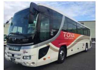
〈ライナー運行区間：東武日光駅 ～ 塩原温泉バスターミナル～那須湯本温泉〉

日光国立公園北部に位置する日光・鬼怒川・湯西川・塩原・那須 エリアを結ぶ期間限定バスと、宿泊プランを組み合わせました商品です。 多彩な温泉や雄大な自然を目一杯楽しむことができるとともに、 満喫ライナーの車窓からは新緑美しい景色をお楽しみいただけます！