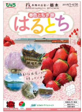
〈総合パンフレット〉

地域の皆さまがDCに向けて考えた企画を先行して商品化しました。 エリア全体でのおもてなしや、県内広域を楽しむコース、ご宿泊いただいた お客さま限定の特別企画など、プレDCならではの商品ラインナップです。 今年初めて、新しく設定した商品をご紹介します。