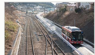
BRTと鉄道との併走区間

気仙沼線、大船渡線で運行中の「BRT」に関する情報や各地を走るイベント列車などの三陸沿岸への旅行商品パンフレットなど、三陸へのお出かけ情報が満載です。お子さまから大人の方まで、沿線の雰囲気や魅力に触れていただき、是非三陸地方へお出かけください。