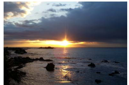
和田浦から望む初日の出（イメージ）

今年も、伊豆・犬吠埼・南房総・常磐方面へ乗換えなしの直通列車を運転します。犬吠埼・南房総方面への「初日の出号」では、乗車券類と朝食・温泉入浴などをセットにした「びゅう商品」を発売します。