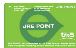
カード券面（イメージ）

2016年2月にスタートしたJR東日本グループ共通ポイントです。駅ビルでのお買物やご飲食の際に100円（税抜）で1ポイントが貯まり、1ポイント（＝1円）単位でお使いいただけます。2017年2月16日からは東北エリアの駅ビルでもご利用いただけるようになり、ますます便利になります。