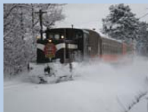
津軽鉄道 ストーブ列車