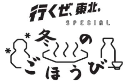
キャンペーンロゴ