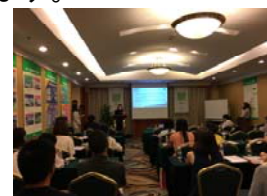
中国(北京)での説明会

台湾、香港、中国、タイ、マレーシア、インドネシアにおいて、10月下旬～11月上旬に開催予定