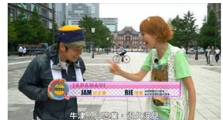
テレビ番組「日本大放送 Go! Japan TV」