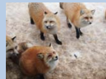
宮城蔵王 キツネ村 タクシープラン