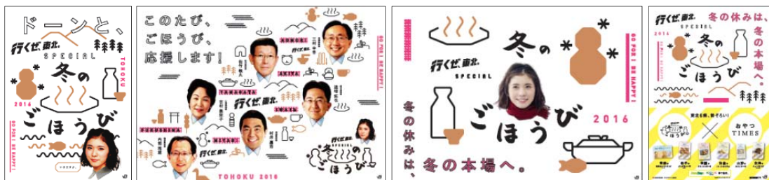
ポスター（イメージ）

「行くぜ、東北。」のイメージキャラクターである松岡茉優さんと「雪祭り&絶景」「温泉」「食」「酒」をシンプルにデザインしたアイコンの組み合わせで、冬の東北の魅力をPRします。また、東北6県知事が登場した「おもてなし感」満載のポスターも作成します。