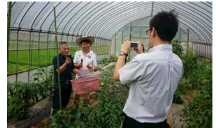
夏季 タイメディアの招請