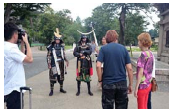
香港メディアの招請（撮影）