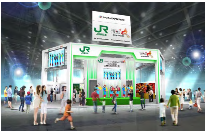
東北観光推進機構と連携したJR 東日本メインブース（イメージ）