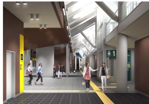
改札内コンコース