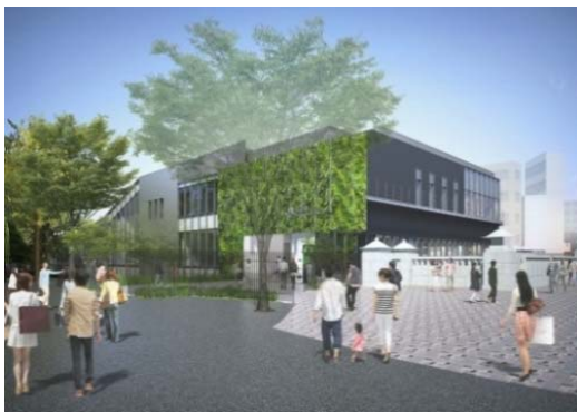
駅外観(明治神宮側)