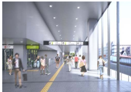
改札内コンコース