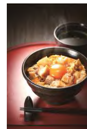
奥久慈軍鶏の親子丼

<ものキッチン池袋東口店> 地域の食材を使用した丼やおつまみを期間限定で販売します。 木内酒造の生クラフトビール各種 茨城県産食材を使用したおつまみ 等