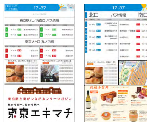
スマートフォンと同じ情報をサイネージにも表示

各コンテンツの情報 (発車時刻など)は自 動的に更新されます。 (タッチパネルなどの 操作はできません。)