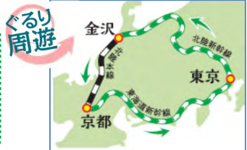
イメージ※地図は略図です