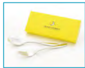
フォーク&スプーン(イメージ)