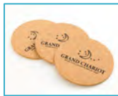
コースター(イメージ)