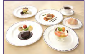
フランス料理(イメージ)