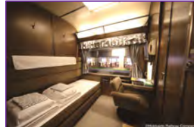
A寝台個室[ロイヤル](イメージ)