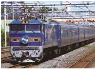
寝台特急「北斗星」号(イメージ)

1988年より多くの人に親しまれてきた「ブルートレイン」北斗星が、上野発では2015年8月21日(金)の運行を最後に引退することとなりました。そこでJR東日本では、びゅう旅行商品「いよいよラストラン！ブルートレイン北斗星で行く北海道」を発売します！夏のさわやかな北海道へラストランを迎える北斗星に乗ってでかけませんか。