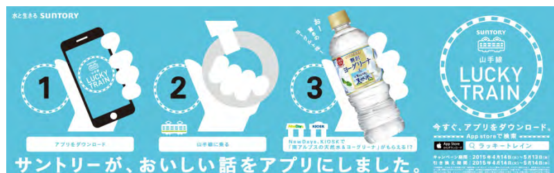
中吊り広告イメージ