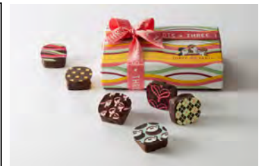
「スリーターツ」 商品イメージ