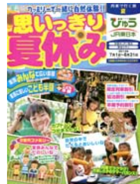
(パンフレット表紙)