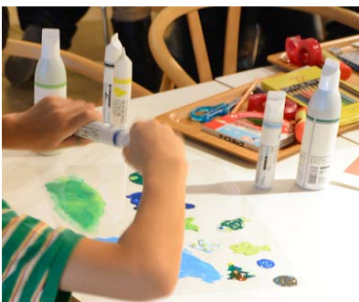
マスクングカラー体験教室