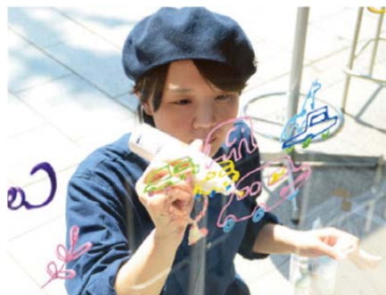
ライブペインティング