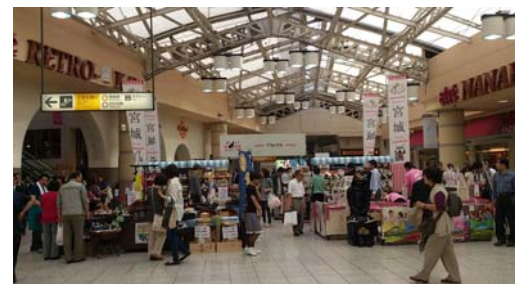
<昨年の「宮城産直市」の様子>