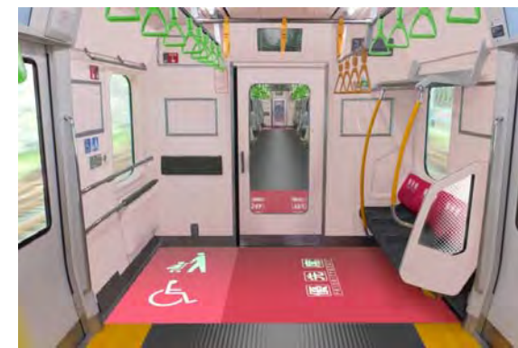
優先席・フリースペースイメージ

※ベビーカーマークはE235系以外の車両の車いすスペースにも順次掲出を行う計画です。