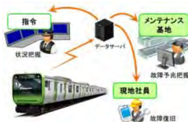
状態監視イメージ

※ベビーカーマークはE235系以外の車両の車いすスペースにも順次掲出を行う計画です。