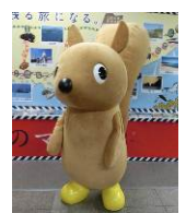
おっぽくん(当社) BRT 沿線復興 キャラクター