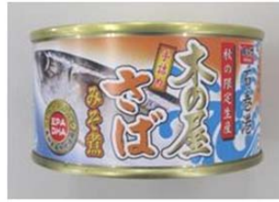
木の屋さばみそ煮