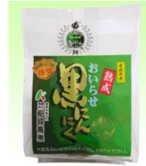
おいらせ黒にんにく