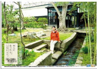
長井・山の港町篇(イメージ)