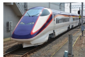
「つばさ」の新しいエクステリアデザイン