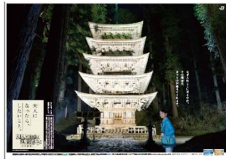
鶴岡・修験の山篇(イメージ)