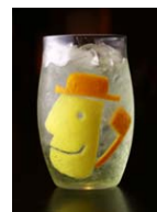
「きてけろくんカクテル」 (イメージ)