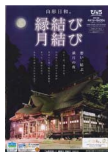
「縁結び・月結び」 置賜エリアの熊野大社の「縁結び・月結び」を商品化。宿泊型のご旅行を提案