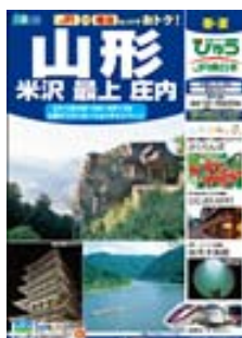
「レギュラー」 JR+宿泊をベースに、「びゅうばす」などの接続交通やオプションプランも設定、観光情報も掲載

山形DCを契機とした地域の皆さまによる観光素材の掘り起こし・磨き上げと連携し、「食」「温泉」「歴史・文化」「自然」「人情」といった山形の魅力を、「朝」「昼」「夕」「夜」の山形の日を通して楽しめる体験・滞在型のご旅行を提案します。また、「観光素材」「駅からの接続交通」「列車の旅」を組み合わせ、山形・東北新幹線と羽越本線・上越新幹線を利用して県内各エリアや隣接県を周遊できる観光ルートを整備し、商品化します。