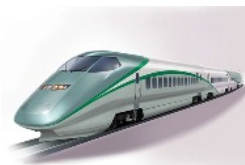
「とれいゆ つばさ」(イメージ)

※指定席特急券、旅行商品の発売開始日など詳細につきましては6月中旬頃別途お知らせいたします。