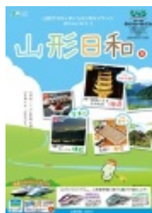
「山形日和。」 食・自然などの山形の一日の観光素材と駅からの接続交通を組み合わせた商品を中心に掲載