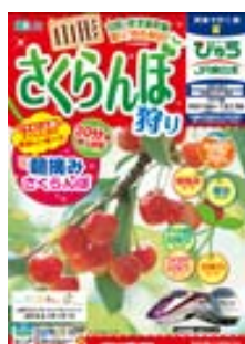
「山形さくらんぼ狩り」 「朝摘みさくらんぼ」やイベント列車「さくらんぼ風つご号」、「びゅうばす」を組み込んだ商品設定