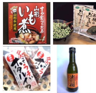
山形の「食・酒」(イメージ)