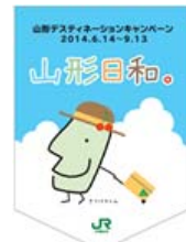
のぼり旗・フラッグ(イメージ)