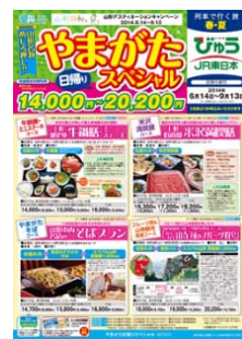
「日帰りスペシャル」 牛肉、そば、フルーツ狩りなど山形の名物を日帰りで楽しむ各コースを設定