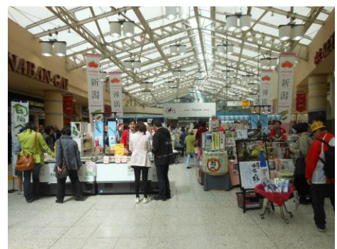
< 昨年の「新潟産直市」の様子 >