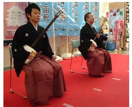
< 昨年の様子 >