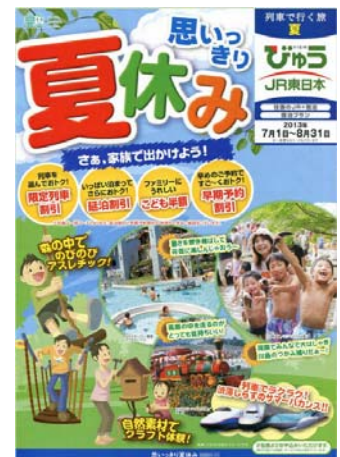
(パンフレット表紙)