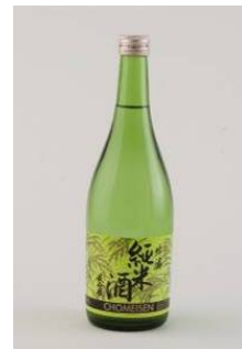
「長命泉 吟醸純米」 (株)滝沢本店

ビタミン、ミネラル、食物繊維などを豊富に含んだ江戸前海苔がパウダーになりました。パウダー状のため、さまざまな料理にも幅広くご利用いただけます。