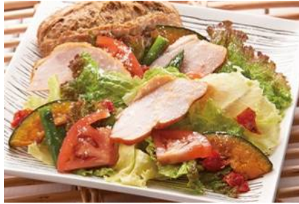
田谷ミートのスモークチキンサラダプレート