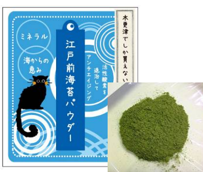
「江戸前海苔パウダー」 清見台カフェ

鮫子港に6月から9月頃に、水揚げされる脂の乗ったマイワシを原料に、千葉県産の天然醸造醤油を使用した千葉県産にこだわった商品です。