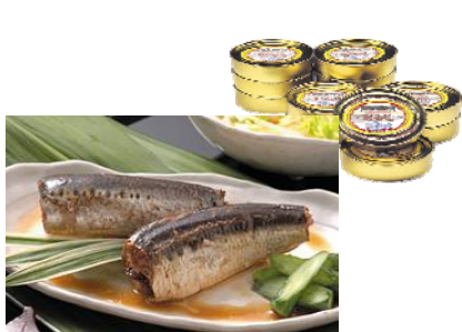
「鮫子産いわし しょうゆ味」 信田缶詰(株)

鮫子港に6月から9月頃に、水揚げされる脂の乗ったマイワシを原料に、千葉県産の天然醸造醤油を使用した千葉県産にこだわった商品です。