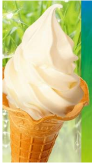
ちばの牧場牛乳ソフトクリーム

○田谷ミートのスモークチキンサラダプレート ○鮫子産いわし煮 ○くじらハム ○田谷ミートのコンビーフ