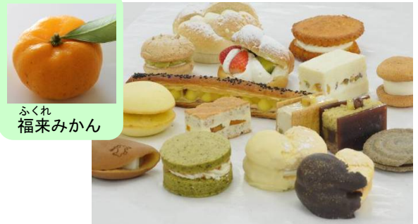
ふくれ福来みかん