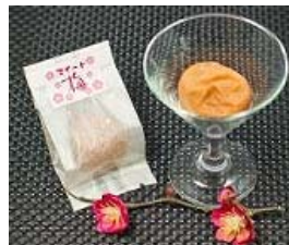
「スイート梅」 ＜吉田屋＞

大丸屋オリジナルの焼き干しいも。蜜のように甘い芋を使用しているため、焼くことで更に甘く香ばしい味わいです。