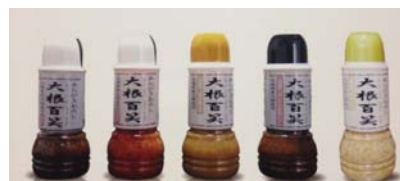
「大根百笑」 ＜ナガタフーズ＞

納豆菌第17回全国納豆品評会優秀賞受賞。茨城県工業技術センター提供のオリジナル納豆菌に覆われたその姿はまるで雪のよう。豆はふっくら、豊かな旨みをご賞味下さい。