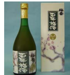
「梅香 百年梅酒」 ＜明利酒類＞

スイート梅は、ほんのりと甘く、とても食べやすい梅のスイーツです。デザート感覚で、梅干しが苦手な方も召し上がれます。