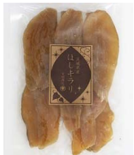
「ほしキラリ」 ＜幸田商店＞

近年話題のサツマイモの新品種「ほしキラリ」の干しいもです！やわらかく食感が程よくあり、上品な口当たりが特徴です。