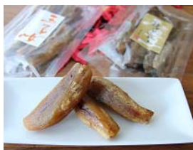
「みつき芋焼きほしいも」 ＜大丸屋＞

近年話題のサツマイモの新品種「ほしキラリ」の干しいもです！やわらかく食感が程よくあり、上品な口当たりが特徴です。