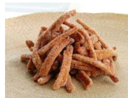
「かりんとう」 ＜コルカリノ＞

茨城県笠間市産の大根だけを原料とした、大根農家のドレッシングです。大根を粗くおろした「あらびきおろし」を使用しているため、大根の食感と風味をお楽しみいただけます。肉、魚、野菜どの食材とも相性抜群です。