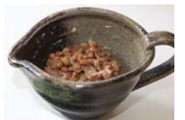
笠間焼納豆鉢(イメージ)