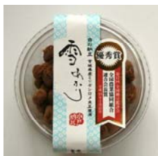
「雪あかり」 ＜水戸納豆製造＞

甘みと上品な味わいにトロリとした独特な舌触りと米のつぶつぶとした喉ごしが特徴。昔ながらの製法で仕込まれたどぶろくです。