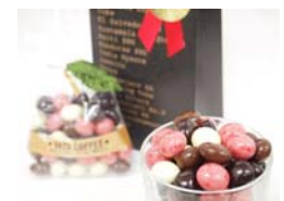
「コーヒー豆チョコ苺ミックス」 ＜サザコーヒー＞

アールグレイ、カフェラテ、赤ワイン、モンブラン、ピターショコラ、ホワイトショコラ、あま酒・桜の香など、色々なフレーバーのかりんとうが揃いました。