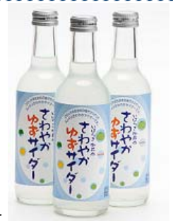
【さわやかゆずサイダー】

茨城県北西部の中山間地域にあり、関東平野北端の田園風景を合わせ持つ風光明媚な土地です。4月9日(火)からは、久慈川堤防1,300mに亘り、ソメイヨシノなどの桜が咲き誇る「さくら祭り」を開催します。また、開花から1週間程ライトアップも行い、夜桜を楽しむことができます。