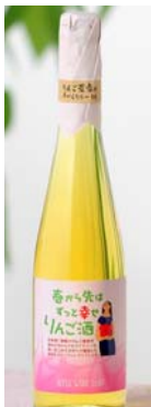
【春から先はずっと幸せりんご酒500ml】

鶴田町は、津軽富士「岩木山」を臨む津軽平野のほぼ中央に位置しており、全長300mの青森ヒバ造りの三連太鼓橋「鶴の舞橋」が架かる津軽富士見湖を有する観光地です。地元産原料にこだわったリンゴジュースや煎餅などを用意しています。