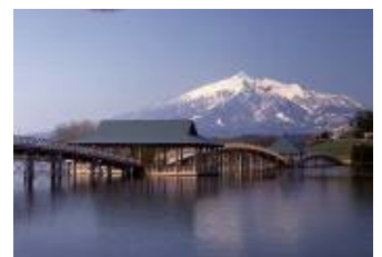
【岩木山と津軽富士見湖に架かる鶴の舞橋】

黒石市は青森県の中央に位置する、豊かな自然に恵まれた「りんごと米といで湯の里」です。生のままでも美味しいサンふじを100%使用したりんごのスパークリングワイン「春から先はずっと幸せりんご酒 500ml」をはじめ、りんごを使った商品を紹介します。