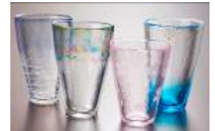
津軽びいどろ(青森県伝統工芸品)