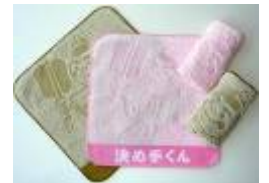
オリジナルハンカチ

※スタンプ台紙は各店舗に設置してあります。どちらの店舗からでもご参加いただけます。