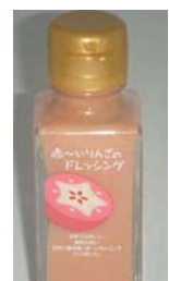
【あか～いりんごのドレッシング】

五所川原市は、高さ23メートルの天を突く巨大な立佞武多や、太宰生誕の地金木町、またヤマトしじみで知られる十三湖など多彩な観光地を有しています。果肉まで赤いりんごのドレッシングや、十三湖産しじみを使った商品を多数用意しています。