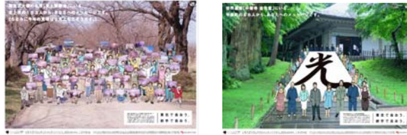
駅掲出ポスター(イメージ)