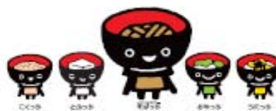
キャンペーンキャラクター「わんこきょうだい」