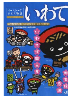
キャンペーンガイドブック