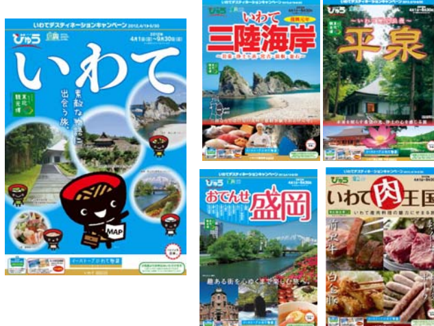
【首都圏発旅行商品パンフレットの一例】