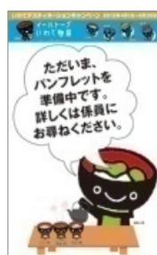
パンフレットスタンド用 バックボード