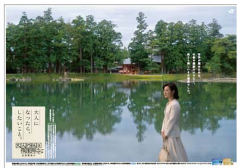
【「大人の休日倶楽部」ポスターイメージ】