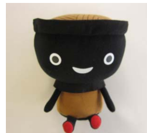
「そぼっち」ぬいぐるみ