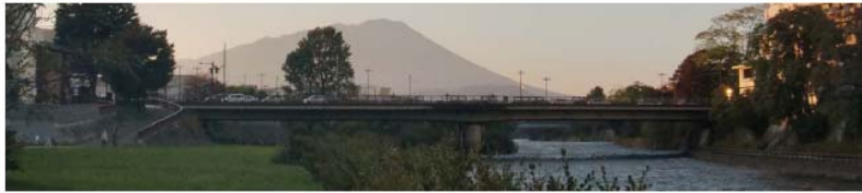
車内吊り(窓上)ポスター(イメージ)