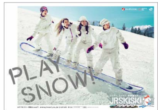
キャンペーンポスター

おススメ情報や楽しい情報の例：メンバーだから知っているとおきビュー・ポイントや「ゲレ食」イチ押しメニュー等 おススメ情報に対して、一般の方からコメントを投稿いただけるほか、「いいね！」ボタンによる友人同士の情報共有が可能です。