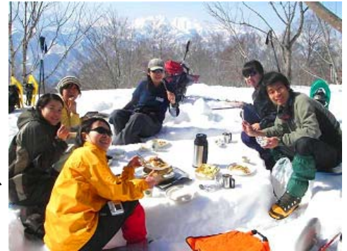
「Winter Day Camp in NAEBA」イメージ

「Winter Day Camp in NAEBA」では、雪の中のハイキングやスノーシュー(西洋かんじき)、エアボードなど、スキー、スノーボード以外のスノーアクティビティを皆さまで体験していただきます。ペアを組んで宝探しをしたり、雪で作ったテーブルと椅子で軽食を食べたり、普段はできない体験をお楽しみいただけます。(内容は変更となる場合があります。)