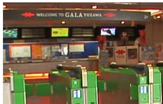
駅改札口を出た先にあるGALA湯沢チケットカウンター