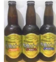
松島ビール ヴァイツン (左) ヘレス (中) デュンケル (右) サンケーヘルス (株)

大津波により大きな被害を受けた石巻市にある平孝酒造。ライフラインが寸断された中でも生き残ったお酒です。