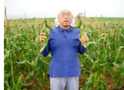
とうもろこし 丸森町産

甘酸っぱく、粒ぞろいです。そのままでも美味しいですが、ヨーグルトなどに混ぜても良く合います。