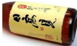
日高見 山田錦 純米吟醸 (株) 平孝醸造

大津波により大きな被害を受けた石巻市にある平孝酒造。ライフラインが寸断された中でも生き残ったお酒です。