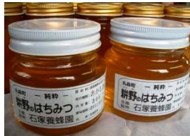
はちみつ 石塚養蜂園

ミツバチが一生涯の間に集める蜜の量はティースプーン 1 杯分です。ミツバチが集めた大切な蜂蜜の中から、定番の「アカシア」や「トチ」をはじめ、さまざまな種類を販売します。