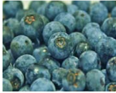
ブルーベリー 丸森町産、蔵王町産

出始めの「豊水」。宮城の梨は甘みもジューシーさもバツグンです。まずはお試しください。