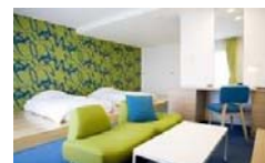
コンセプトルーム