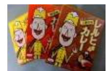
レルヒさんカレー