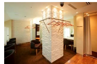
IDÉE デザインの家具 【パウダールーム】