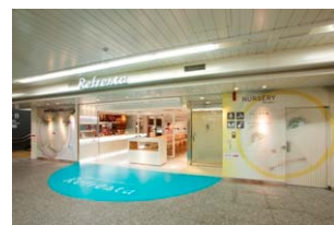
【リフレスタ ファサード】