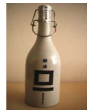
「スクウェア・ワン」

合資会社 和泉屋商店 ふんわり軽いマカロンに、和泉蔵味噌をのせて焼き上げた香ばしい和スイーツです。サクサクとした食感のあと、口の中でとろけていくのが特徴です。