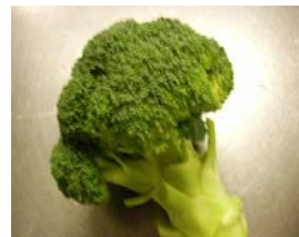
長野県朝日村産 「ブロッコリー」