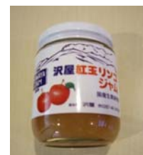
「紅玉りんごジャム」

株式会社 おびなた 美味しいそばに必要な良質なそばの実と良質な水の両方を兼ね備えた戸隠の地で、丹精込めて作りました。生そばとそばつゆがセットになっているので、簡単に美味しいおそばを召し上がっていただけます。