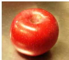
長野県千曲市産 「ふじ」