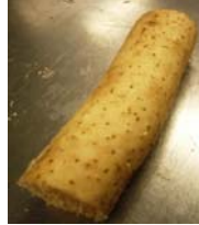
長野県山形村産 「長芋」