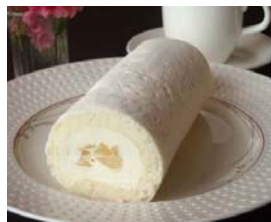
「ラ・フランスロール」

株式会社 アトリエド・フロマージュ クリームはマスカルポーネと長野県産の採りたてをコンポートしたラ・フランスが入り、滑らかでさっぱりした味です。生地は、きめが細かくもっちりした食感が特徴です。