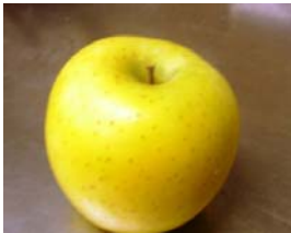
長野県長野市産 「シナノゴールド」