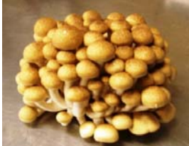
長野県飯山市産 「やまびこしめじ」