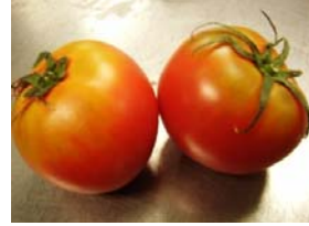
長野県長野市産 「フルーツマト」