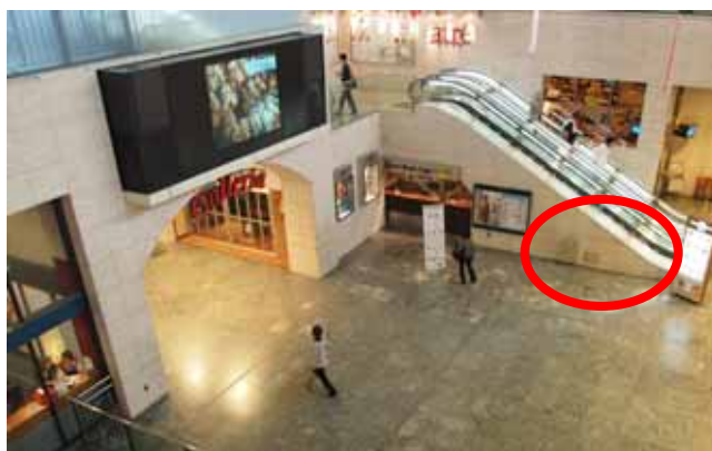
ブース設置位置 (上野駅中央改札外 ガレリア内)