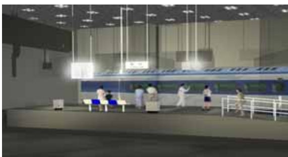
【開業当時の東京駅新幹線ホーム一部情景再現イメージ図】