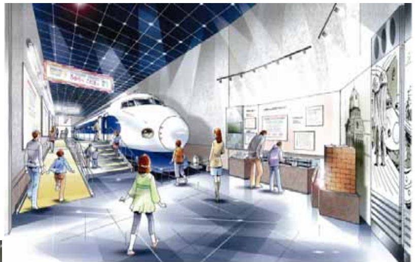
【0系新幹線展示イメージ図】