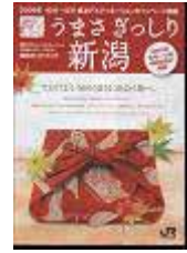
総合ガイドブック

DC期間中の新潟県・山形県庄内エリアのイベントや観光情報など、キャンペーン情報が満載。 主なJRの駅、旅行会社窓口等で配布します。