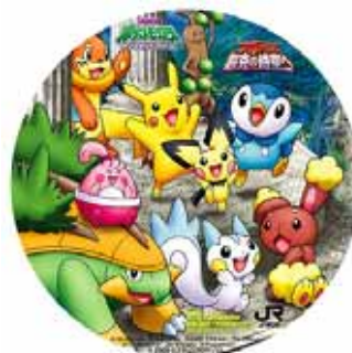
スタンプラリーの賞品・オリジナル缶バッジ(イメージ)

©Nintendo・Creatures・GAME FREAK・TV Tokyo・ShoPro・JR Kikaku ©Pokémon ©2009 ビデオゲーム