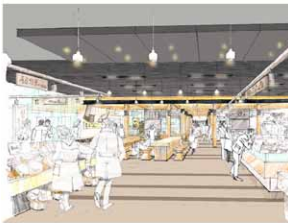
コンコースエリアの概観