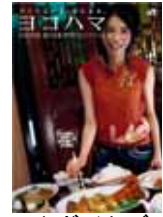
イベントガイドブック

DC期間中の横浜市及び近隣都市のイベントや観光情報などキャンペーンの情報を満載。JRの駅や旅行会社窓口等で配布します。