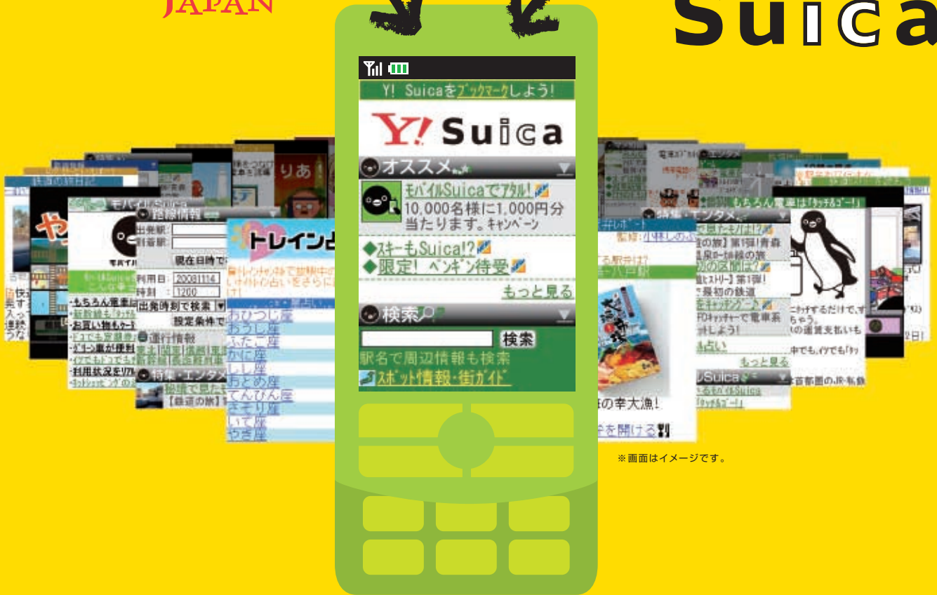
※画面はイメージです。

JR東日本 × Yahoo! JAPAN 毎日使えるケータイサイト「ヤフー・スイカ」