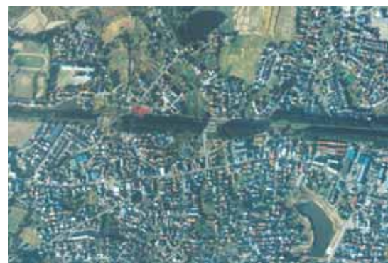
奥羽本線 津軽新城1～4号林(緑地)