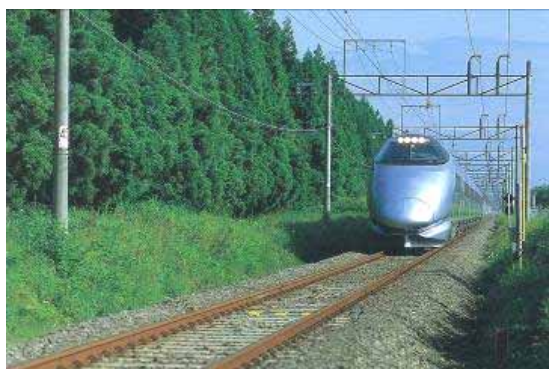
奥羽本線 関根1号林(ふぶき防止林)