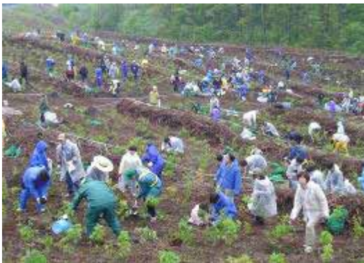
地元の福島県二本松市のみなさまにもご協力 いただき、3年間で5万本を植樹します

福島県安達太良地域の国有林地で 2004 年から取り組んでいる植樹活動です。土地本来の木である 22 種を選定し、まず、3年間かけて安達郡大玉村で4万5千本の苗木を植樹しました。また、第4回目となる 2007 年からは、同じ安達太良山のふもとの福島県二本松市で 17 種5万本を 2009 年度までの3年間で植樹していきます。2007 年は、JR東日本グループの社員のほか、地元のみなさまや一般の方など約 800 名のご参加をいただきました。