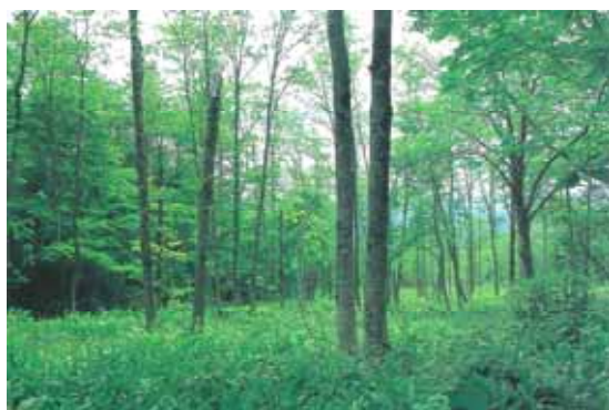
奥羽本線 板谷6号林(水源涵養林)