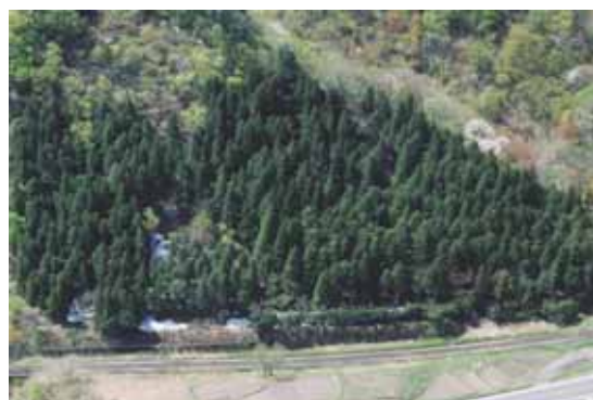
米坂線 手ノ子6号林(なだれ防止林)