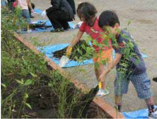
各支社で開催している「鉄道沿線からの森づくり」 には2006年度までに3.6万人が参加

1992年から毎年、JR 東日本エリア内の各支社で植樹活動を行い、地域のみなさまにもご参加いただいています。2006年度までに約3万6千人のご参加をいただき、25万本を植樹しました。今後も継続して取り組んでいきます。