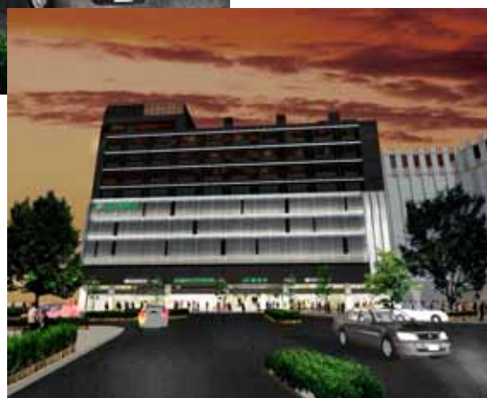
グランデュオ東館外観イメージ