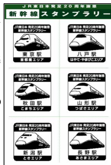
応募はがき・スタンプイメージ

応募締切： 第 1 回 2007 年 6 月 30 日 第 2 回 2007 年 9 月 30 日 第 3 回 2007 年 12 月 31 日 第 4 回 2008 年 3 月 31 日 当日消印有効