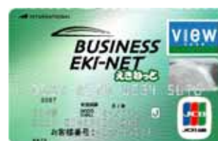
ビジネスえきねっとJCBカード