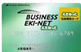
ビジネスえきねっとカード(引取専用)