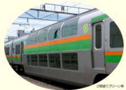
旧編成でグリーン車

2004年秋のダイヤ改正に向け、7月1日(木)より、 宇都宮線・高崎線の上野・池袋駅発着となる列車の 一部に、グリーン車を連結した列車が運転を開始します。 このグリーン車は秋のダイヤ改正前日 までは普通車として使用するため、 グリーン券なしでご利用いただけます。