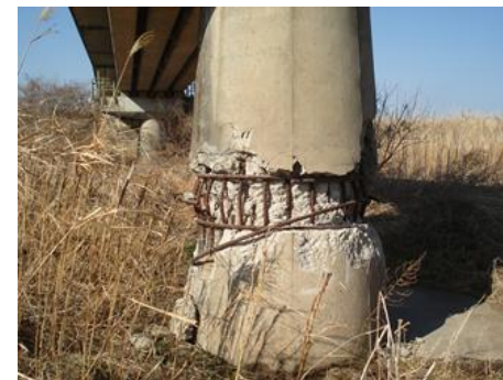
双葉・浪江間 高瀬川橋りょう橋脚損傷