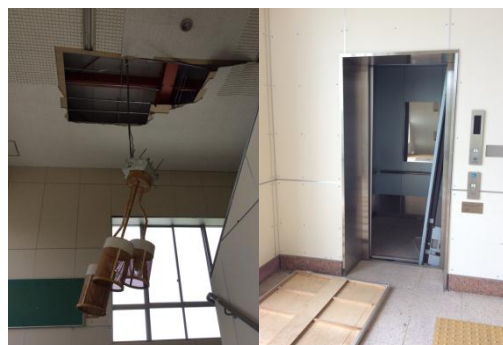
大野駅 駅舎天井・エレベーター損傷